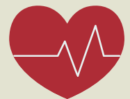
Vitaminas y minerales