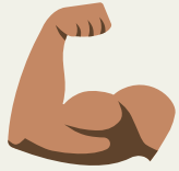
ဖရိၣ်ထံ(န)