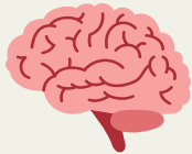
တၢ်အသိၤလၢအဂ့ၢ်လၢတၢ်အိၣ်ဆူၣ်အိၣ်ချ့အဂီၢ်