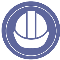
Kev tsim kho