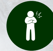
Mob hauv siab