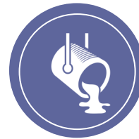
Chaw tsim khoom hlau