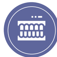
Kev kho hniav

Saib nplooj 2 nrog cov ntaum ntawv txuas ntxiv!