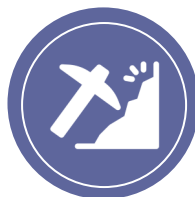
Kev khawb av