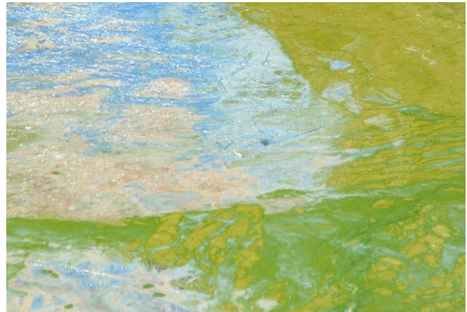
Zoo ib yam li cov xim pleev tsev uas txej los sis xim kua txiv laum huab xeeb