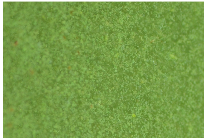
Muaj cov teev xim ntsuab me aiv ntab ntawm cov dej