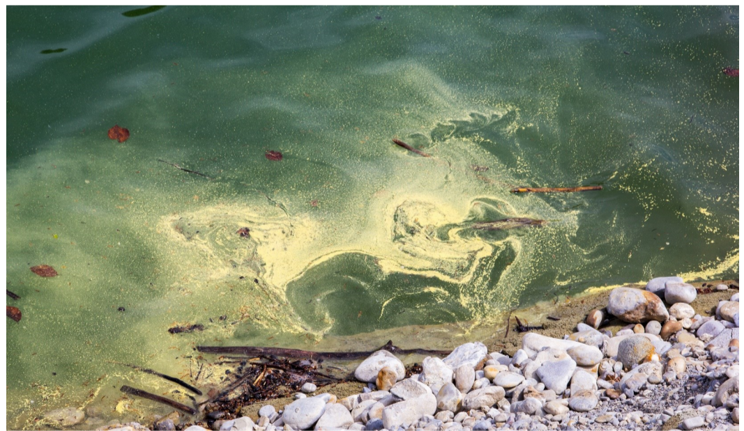
Cov poov paj nroj tsuag uas muaj xim daj