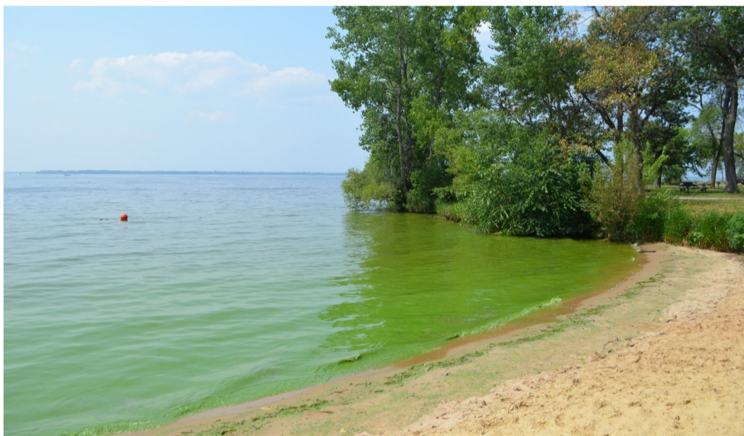
Cov dej kua xim ntsuab uas zoo ib yam li cov kua txiv laum huab xeeb