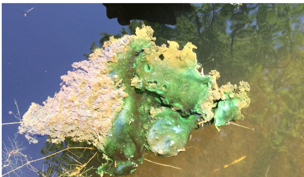
Cov thooj kheej-kheej npog ntab los sis cov ntaub npog nplaim dej