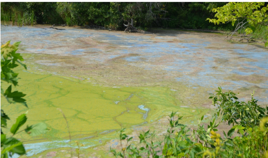
Tej txej dej qias neeg uas zoo li cov xim nchuav