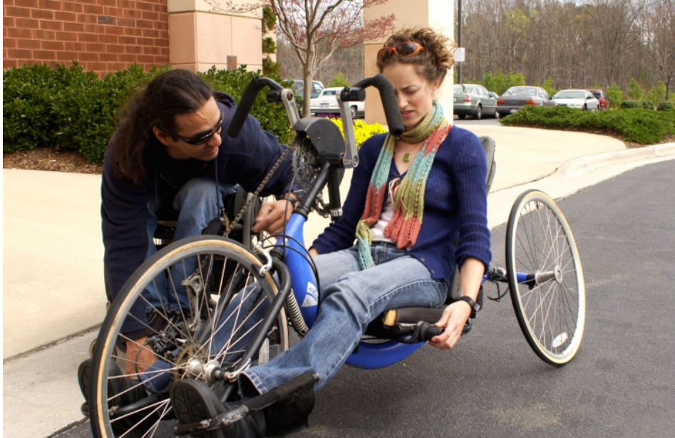
အဘဉ်စၢၤဘဉ် န့ဉ်လီၤ.

တီၢ်နီဉ်-တၢ်မ့ၢ်ဆၢခီနၤဆူ IRIS အပှလၢတၢ်တီၢ်ကျဲၤအဂီၢ်တခါန့ဉ်တၢ်လီၤဖျဲဉ်လီၤဟံတအိဉ်လၢတၢ်မၤစၢၤတဖၣ်