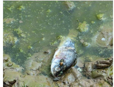
Muaj cov ntses los sis lwm cov tsiaj tuag