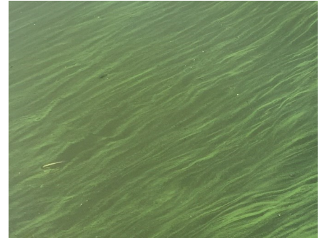
Muaj xim hloov pauv mus los sis ua ib kab tej