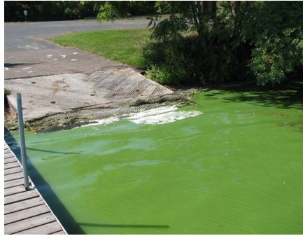
Saib zoo li yog cov kua taum ntsuab