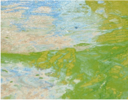
Saib zoo li yog cov kob pleev tsev latex paint txeej