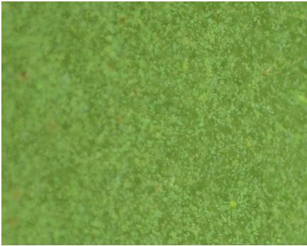
Muaj cov teev xim ntsuab me aiv ntab ntawm cov dej